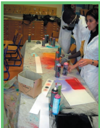
Séance n°1 peinture à la bombe !