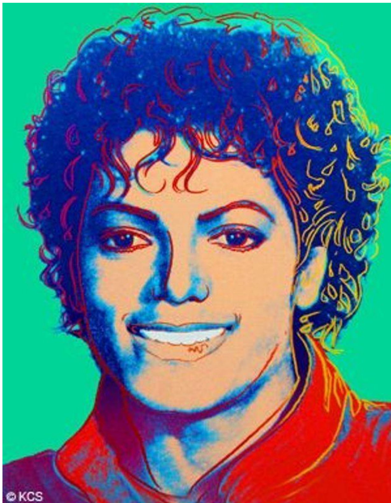
Andy Warhol Portrait de Michael Jackson, Sérigraphie 1984